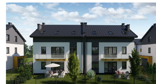
Widok osiedla od strony ogrodu